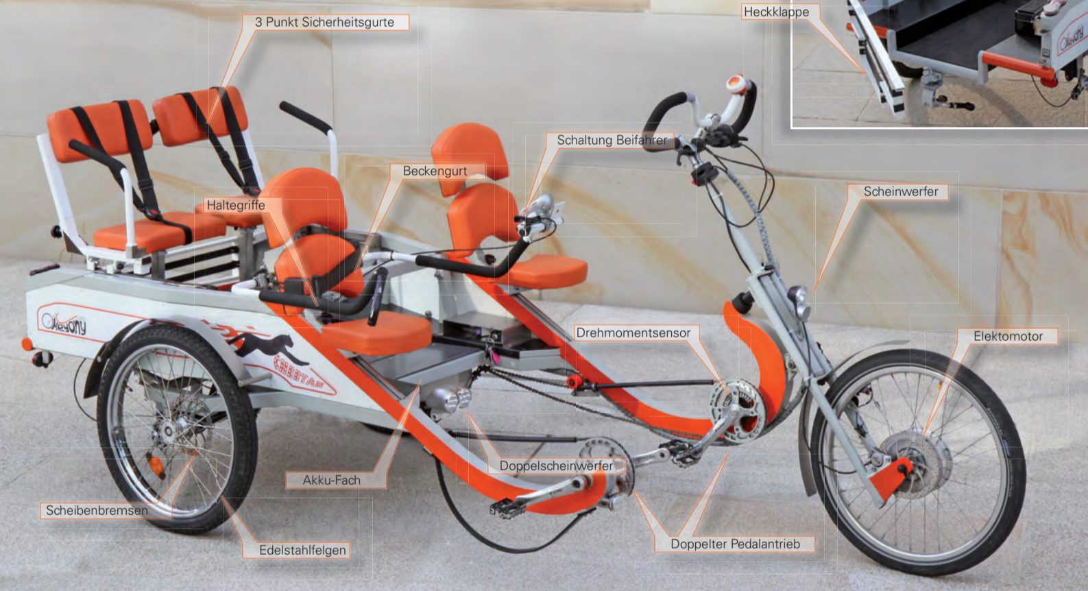
Abb. Prototyp K2, technische Optimierungen vorgesehen! Stand Oktober 2011

Kostenlose Probefahrt sichern! In einer Farbe nach Wahl bestellen!