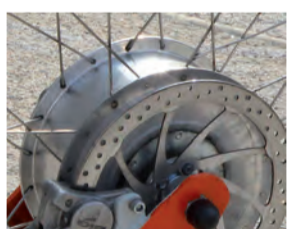
Nabenmotor + Scheibenbremse