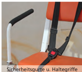
Sicherheitsgurte u. Haltegriffe